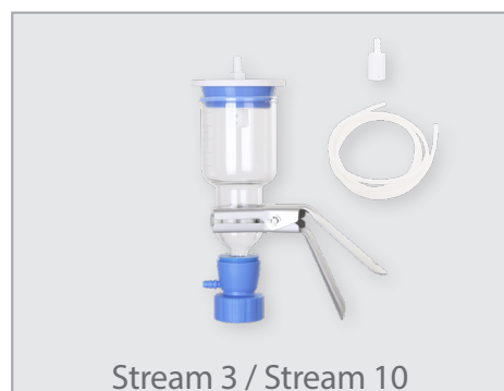
Stream 3 / Stream 10