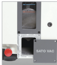
油槽版設計 方便油箱清潔