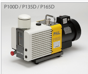
P100D / P135D / P165D