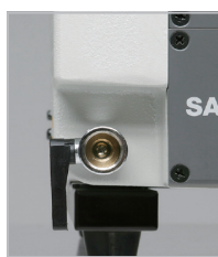
快速洩油閥 簡易更換油品